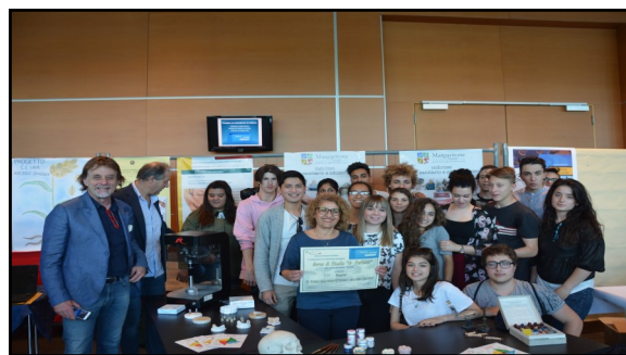
PREMIAZIONE DELL'ISTITUTO VASARI PRESSO LA CAMERA DI COMMERCIO DI AREZZO