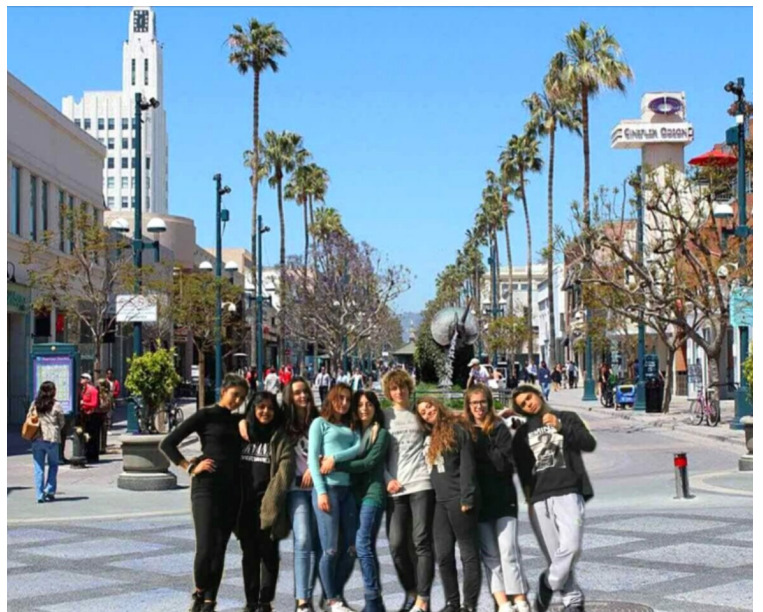
Le nostre ragazze e ragazzi del Tecnico Grafico

Indirizzi Servizi Alberghieri Turistici e Commerciali Indirizzo Odontotecnico Indirizzo Servizi Sociali Indirizzi Tecnici della Grafica e Comunicazione Indirizzo Tecnico Fotografico Indirizzo Tecnico Turistico Operatore del Benessere Estetista